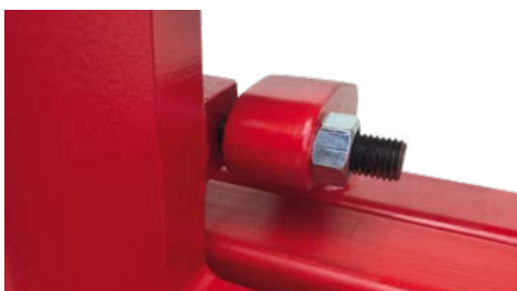
Modularer Adapter für minimalen Öffnungsbereich