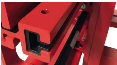
3 alternative Spreizmaße