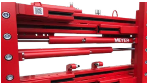
Seitenschieber-Kit für Doppelaufhängung

EINZIGARTIGE MODULARITÄT FÜR HÖCHSTE FLEXIBILITÄT